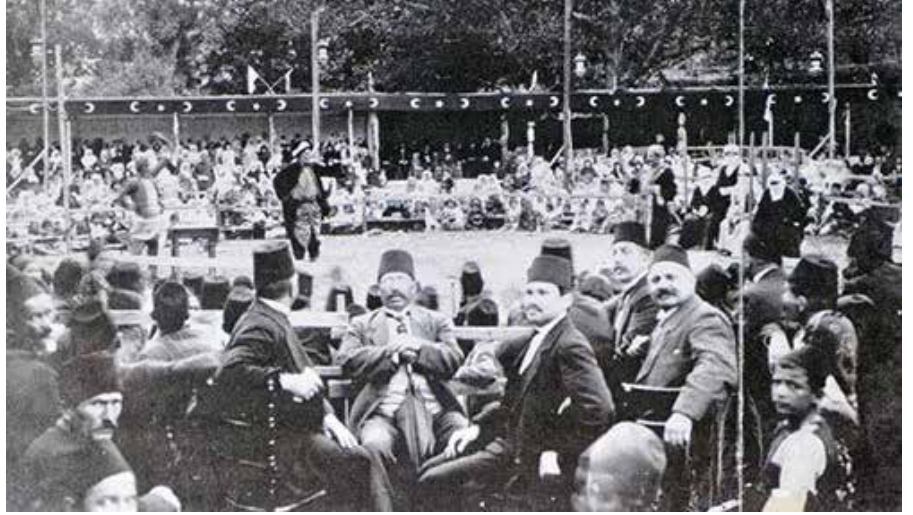
Eski Ramazanlar'da orta oyunu

Saraydan en küçük eve kadar iftar davetleri verilirdi. Paşa konakları ve zengin köşklerinde üst katta davetlilere, alt katta gelip geçenele sofralar kurulur, millet iftar vermekte yarıştı. Herkesin sofrası, her zamankinden biraz daha parlak olurdu. Ramazan sofrasının hususiyetlerinden birisi de hurma ile güllaçtır. Hele güllaç, sanki Ramazana mahsus bir tatlıdır. Bereketinden olsa gerek, Ramazan, fakarının daha çok gözetildiği bir aydır. Zenginler, bu ay başlamadan fakir evlerine bir aylık erzak göndermeyi âdet